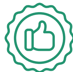
estado de integridad o calidad